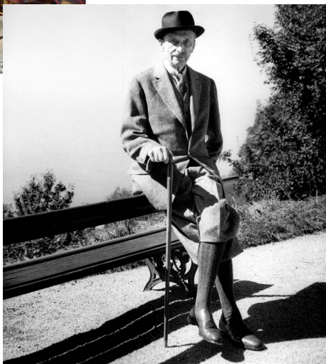
Mannerheim à Montreux