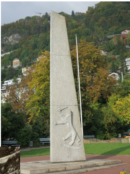
Monument à la mémoire de Mannerheim