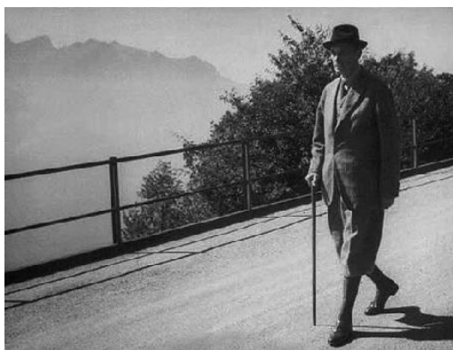
Mannerheim sur la route de Valmont