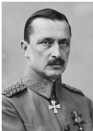
Carl Gustaf Emil Mannerheim

En 1951, à sa mort, un monument est érigé en son honneur à Territet.