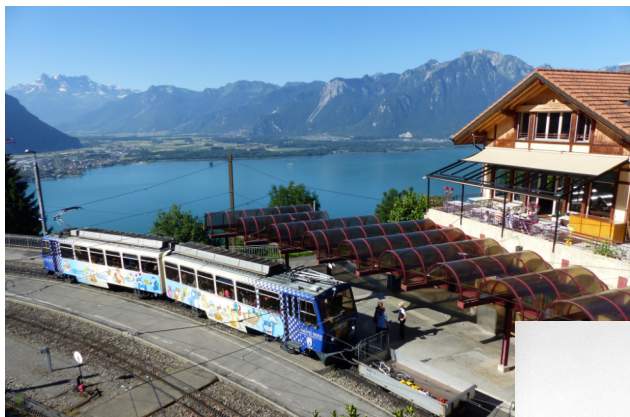
Funiculaire à la gare de Glion