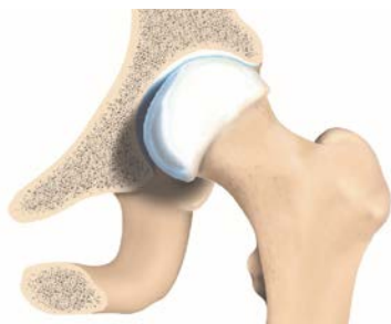
Tête fémorale saine