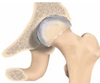
Tête fémorale usée

La hanche est soumise, au quotidien, à de nombreuses contraintes : elle supporte le haut du corps, s'articule à chacun de nos pas et absorbe les pressions causées par la plupart de nos mouvements. Peu à peu, la couche de cartilage s'use et l'arthrose apparaît. Cela provoque des douleurs plus ou moins intenses qui, autrefois, pouvaient conduire à la perte totale de la mobilité. Aujourd'hui, les progrès de la médecine et des techniques chirurgicales permettent de remplacer la hanche malade par une articulation artificielle : la prothèse.